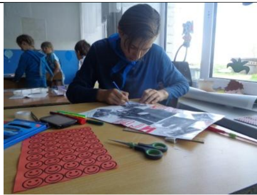
Подготовка к игре