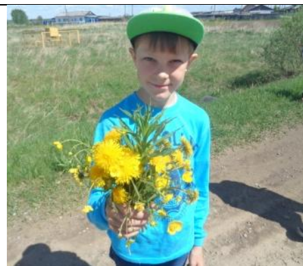
Джентельмен он и в Африке джентельмен