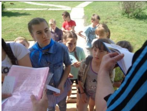
Пойди туда, не знаю куда, принеси то, не знаю что