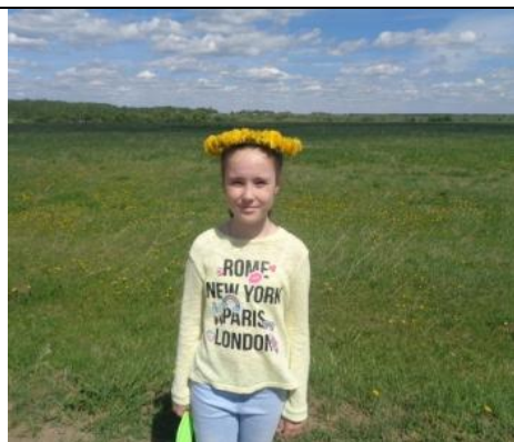
Красавишна - царица полей