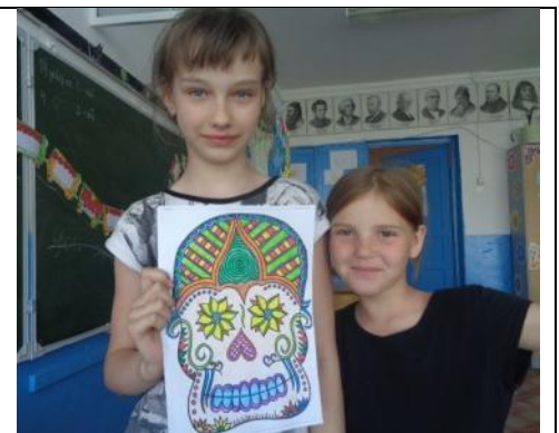
Я страшный и ужасный - Бармалей