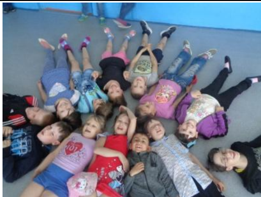
Раз, два, три, морская фигура на месте замри Станция "Стоп-кадр"