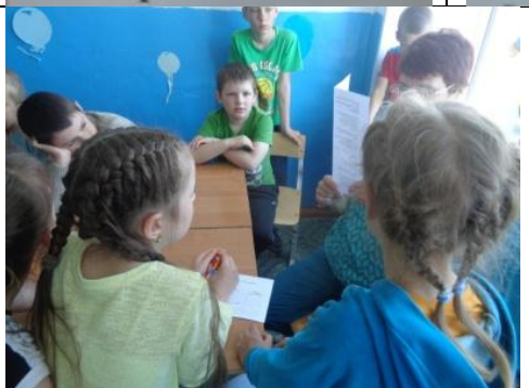
Отгадай загадку - получишь шоколадку