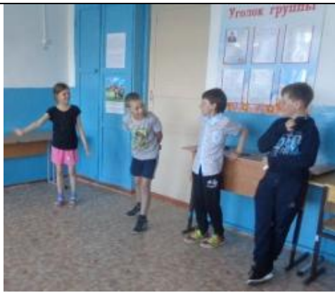
Ну, что ты, принц стесняешься - выходи... Театр "Карабаса - Барабаса"