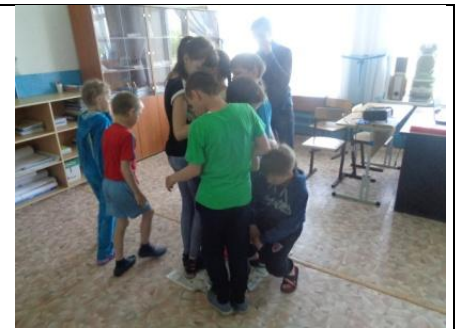
Спасение утопающих - дело рук самих утопающих! станция "Остров спасения"