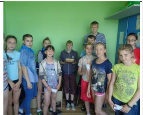
Вот он - главный приз! Ням - ням